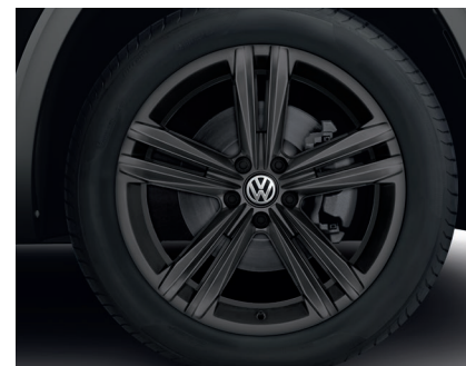
Черные легкосплавные диски R-Line Sebring 8J x 20, 255/50 R20