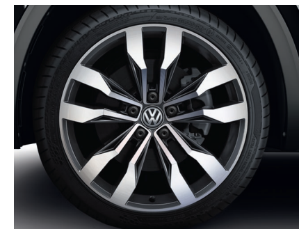
Легкосплавные диски Suzuka 9J x 21, 265/45 R21 (опционально)